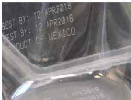
樹脂製品への発色印字