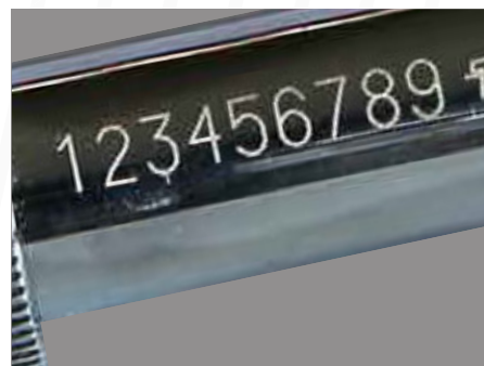
金属への塗装剥離印字