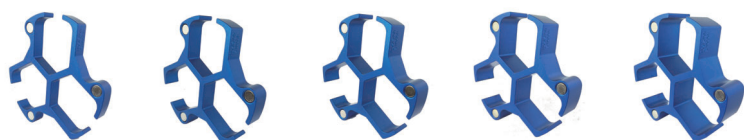
PS-15 PS-20 PS-25 PS-30 PS-35