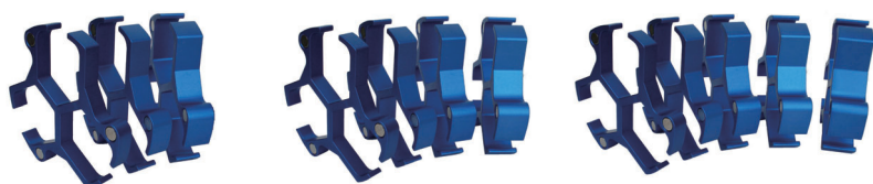
PS-SET3 PS-SET4 PS-SET5