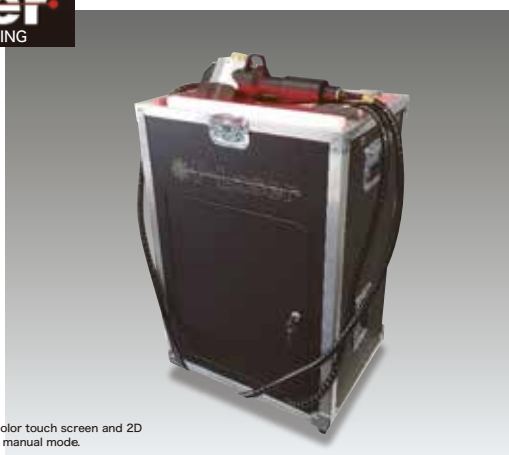
MTR-02 QF-50 watt

Features : 5m fiber, color touch screen and 2D scanner for robot and manual mode.